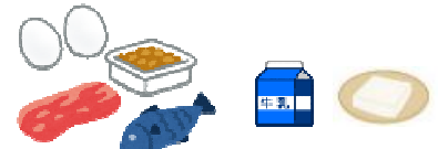
肉・魚・乳製品・大豆製品

免疫細胞を作るもとです。また、寒さに対する抵抗力を高め、体を温める効果があります。