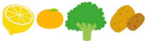
フルーツ・ブロッコリー・芋類など

ウイルスや細菌から体を守ります。体内に溜めておくことができないので、毎日の食事にビタミンCを取り入れましょう。